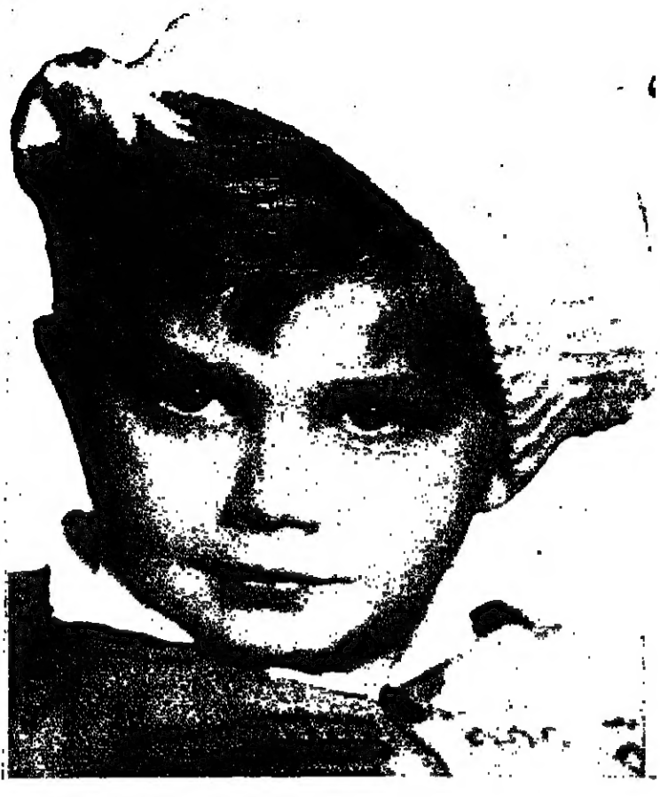
اطفاننا .. اكبانا .. اكبانا التي تمسني